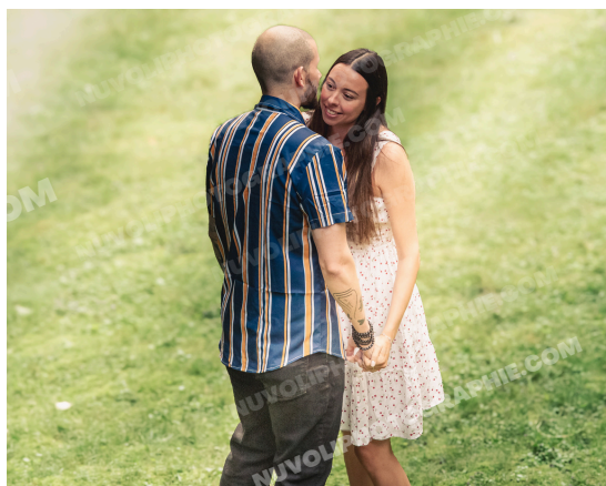
Ambiance engagement poétique