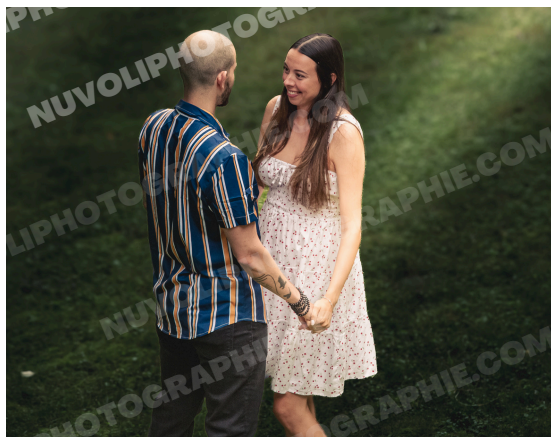
Ambiance intimité en forêt